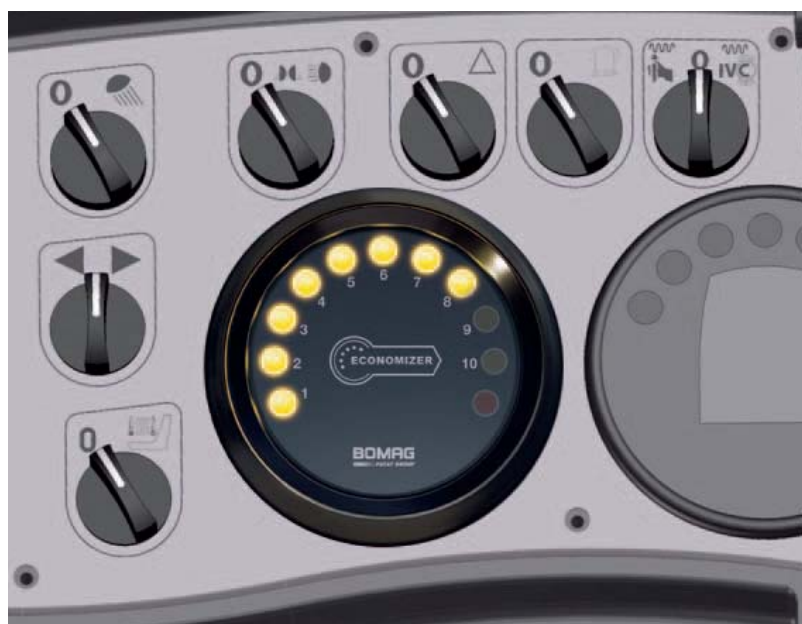
Lückenlose Transparenz in der Verdichtung bietet der BOMAG ECONOMIZER.