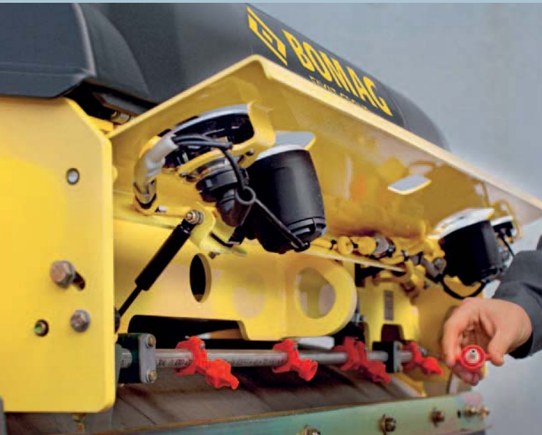
Robust und wartungsfreundlich: das windgeschützte Berieselungssystem hinter der Front- und Heckklappe.